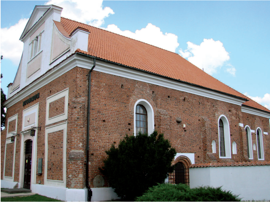
Budynek siedziby Oddziału w Pułtusk Archiwum Państwowego w Warszawie, 2012