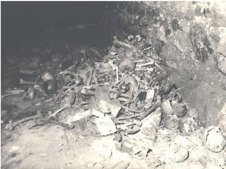
Szcątki żołnierzy napoleońskich znalezione w trakcie prac archeologicznych prowadzonych w krypcie pod kościołem NMP, b.d., Kronika Oddziału w Pułtusku APW