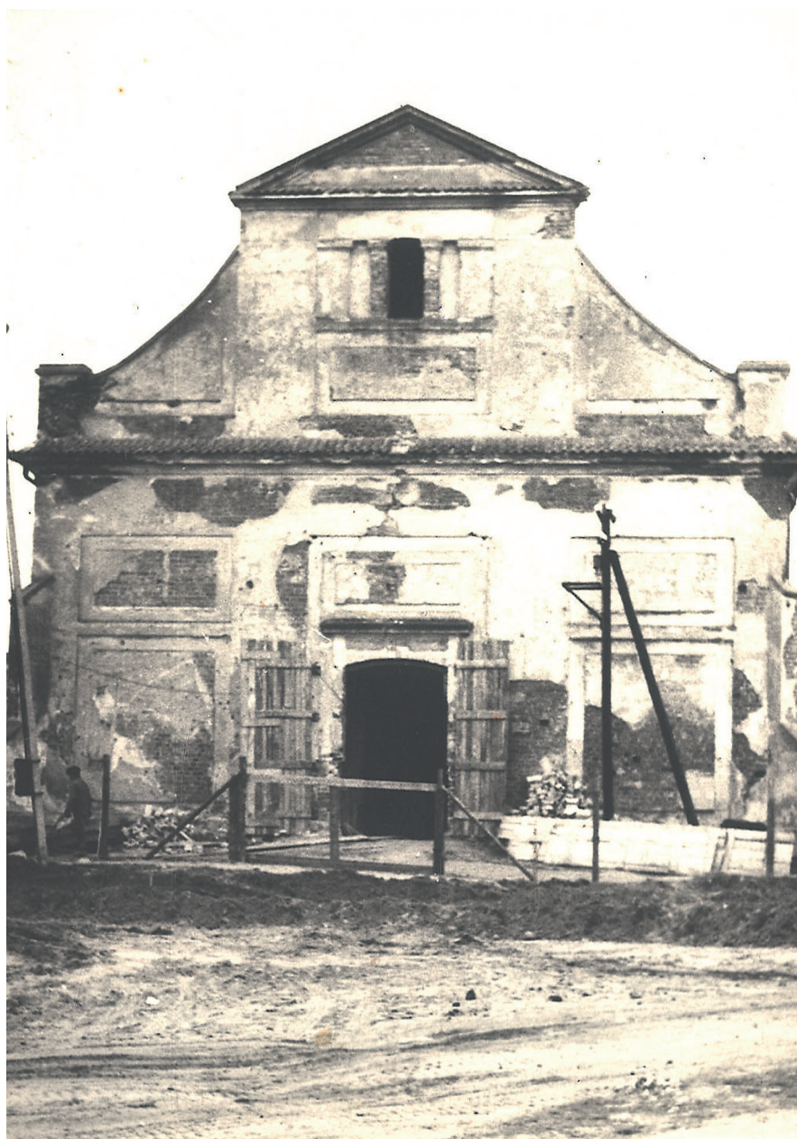
Kościół NMP, 1978