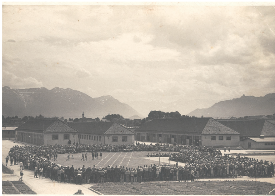
Zawody sportowe jeńców wojennych na placu apelowym w Oflagu 8A Murnau, 1943, Archiwum rodzinne Władysława Kocota, sygn. 42