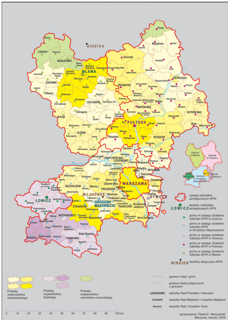
Mapa zasięgu działania Archiwum Państwowego w Warszawie