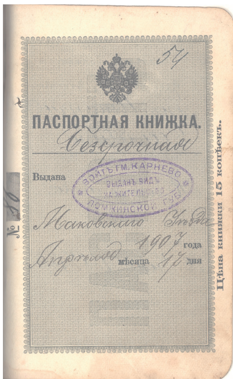
Dowód tożsamości, 1907, Zarząd Powiatowy Makowski, sygn. 61