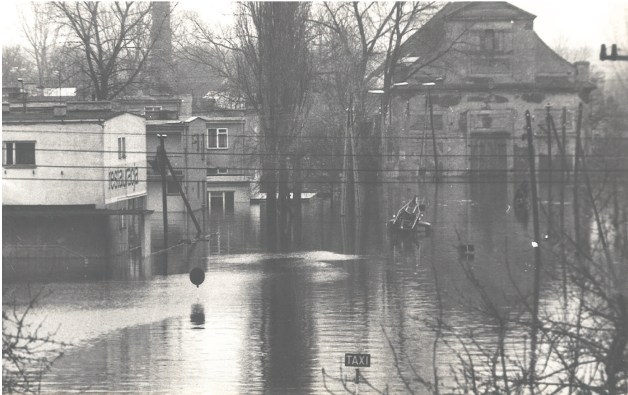
Powódź w Pułtusku, kwiecień 1979