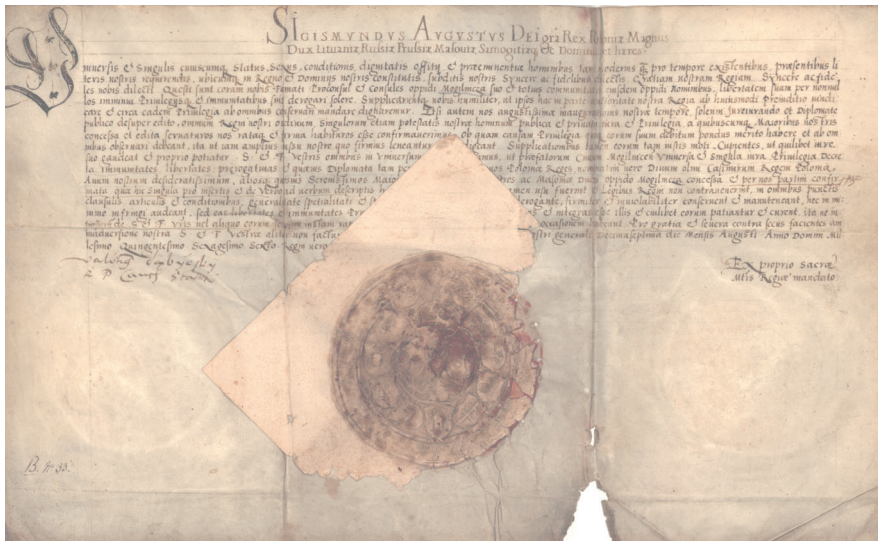
Zygmunt August, król polski, potwierdza przywileje miasta Mogielnicy, 17 sierpnia 1566, Archiwum konwentu plocko-pułtuskiego benedyktynów, sygn.